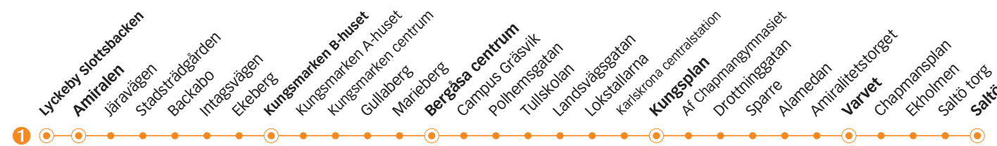
1 SKÄRGÅRDSFESTEN Lyckeby - Kungsmarken - Trossö - Saltö

d) Trafikerar hållplats Kungsmarken C-huset före hållplats Kungsmarken B-huset.