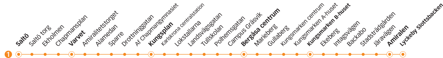
1 SKÄRGÅRDSFESTEN Saltö - Trossö - Kungsmarken - Lyckeby

d) Trafikerar hållplats Kungsmarken C-huset efter hållplats Kungsmarken B-huset.